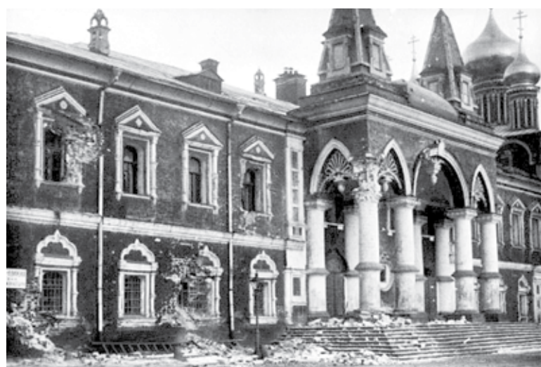
Чудов монастырь после обстрела большевиков.

горя охватывает при виде этих разрушений и ужаса, и чем вы углубляетесь дальше в осмотр поруганной святыни, тем эта боль становится сильнее. С неподдающимся описанию волнением вы переступаете ограду на каменную площадь к великому Успенскому собору и видите огромные лужи крови с плавающими в ней человеческими мозгами. Следы крови чьей-то дерзкой ногой разнесены по всей этой площади.