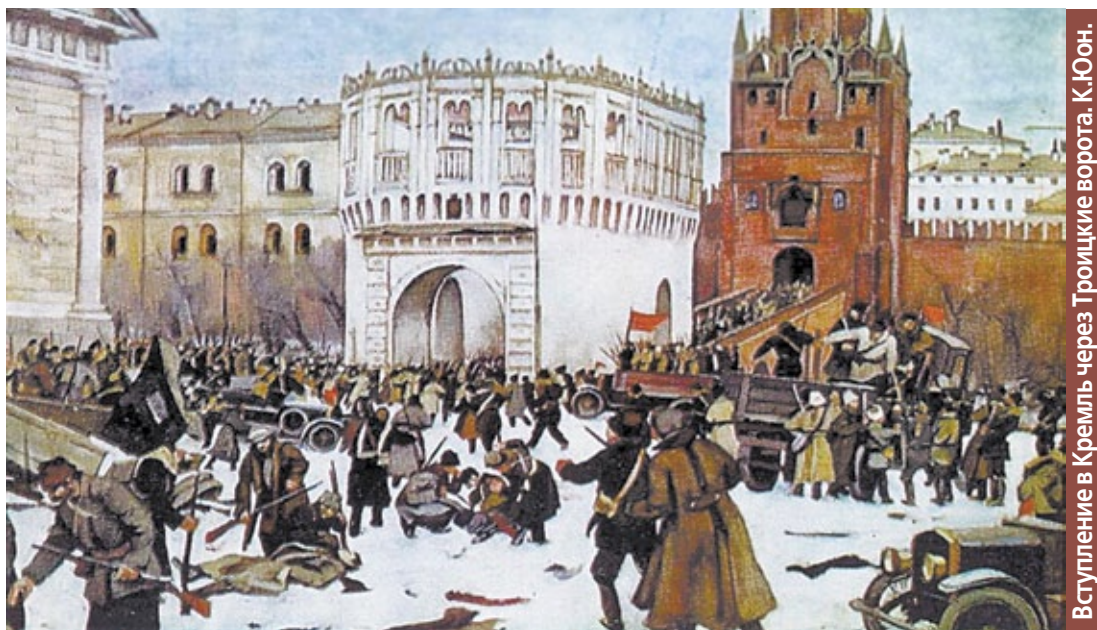
Вступление в Кремль через Троицкие ворота. К.Юон.

Из Вознесенского монастыря мы прошли осматривать разрушение Кремля. Когда находились во дворе Синодальной Конторы, близ казарм послышался какой-то крик и гул толпы, приближавшейся к Чудову монастырю. Когда она при-