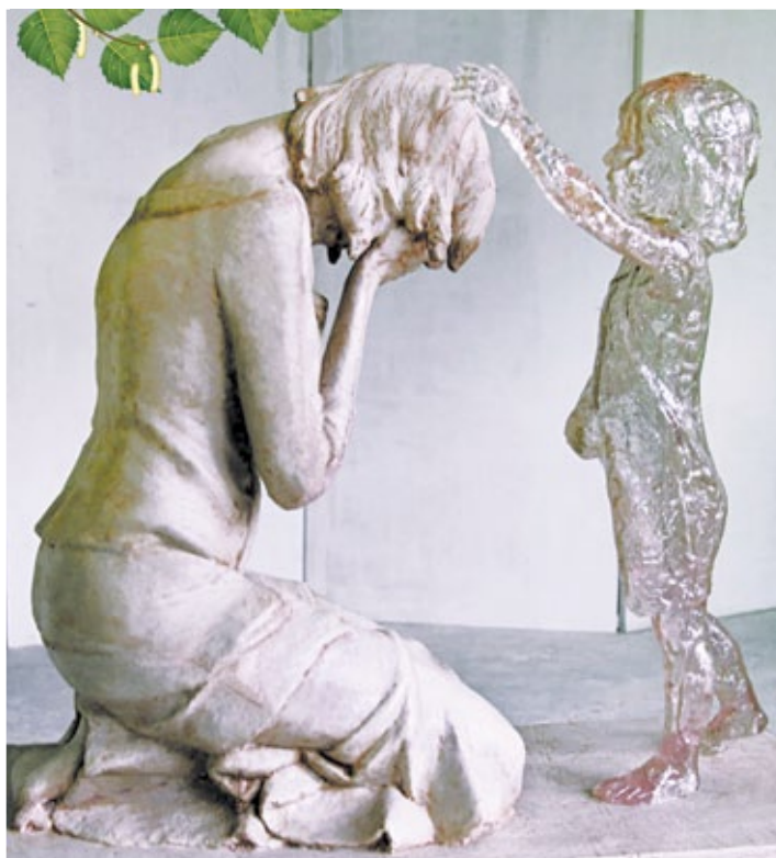
Памятники нерожденным детям устанавливаются в Европе на средства благотворительных организаций и религиозных общин. Самый известный из них находится в Словакии.

Но что еще возможно, кроме исповеди? Здравый смысл подсказывает, что те, кто избавля-