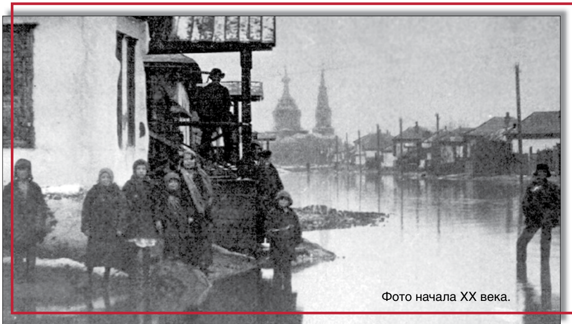
Фото начала XX века.

И вот, по благословению Преосвященнейшего Ириней, епископа Орского и Гайского, 23 ноября 2013 года в Орске впервые пройдет крестный ход к месту порушенной святыни. Малые крестные ходы от храмов города будут стекаться к церкви Покрова Пресвятой Богородицы архиерейского подворья. Откуда в 10 часов 30 минут многолюдное шествие направится в парк Малишевского. Здесь состоится соборное богослужение, которое возглавит Преосвященный владыка Ириней.