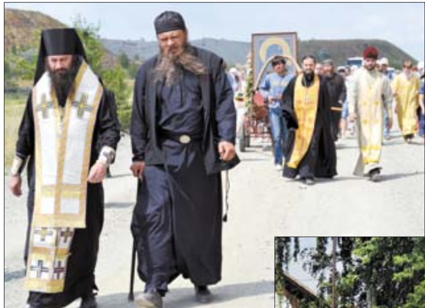
5 июля. День празднования особо чтимой в Оренбуржье иконы Божией Матери «Табынская» широко отмечали по всей Орской епархии.

Гай стал традиционным местом, куда приезжают верующие люди из Орска, Новотроицка и совершают почти 20-километровый крестный ход с образом Пресвятой Богородицы в поселок Херсон, к источнику Табынской иконы Божией Матери. Каждый год подряд крестный ход начинается от собора св. прав. Иоанна Кронштадтского. Отправиться в дальнюю дорогу отказались не только молодые и здоровые, но и люди преклонного возраста, родители с детьми. По пути шествия к ним присоединились прихожане и настоятель храма святых апостолов Петра и Павла г. Гая. Вскоре прибыл и возглавил шествие Преосвященнейший Ириней, епископ Орский и Гайский. До этого владыка уже прошагал немало километров с крестным ходом по улицам Орска. Там праздничное шествие началось от храма Покрова Пресвятой Богородицы (архирейское подворье), затем – к храму Преображения Господня, а завершилось у кафедрального собора св. вмч. и Победоносца Георгия.