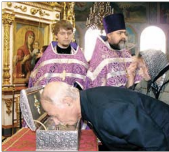
График пребывания мощей:

Встречал святыню Высокопреосвященнейший Валентин, митрополит Оренбургский и Бузулукский идухвенство. Ковчег с мощами был внесен в Никольский