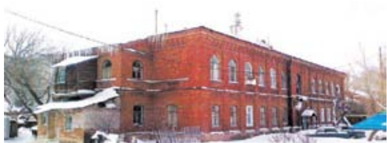
Бывший монашеский корпус