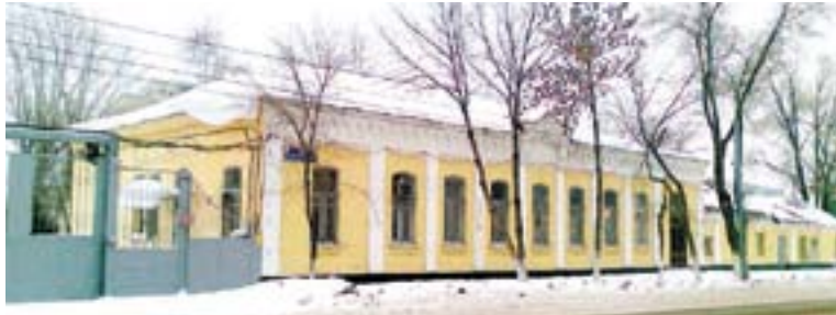
Здание бывшей монастырской церковно-приходской школы