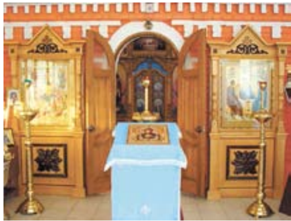
Храм иконы Божией Матери Живоносный источник