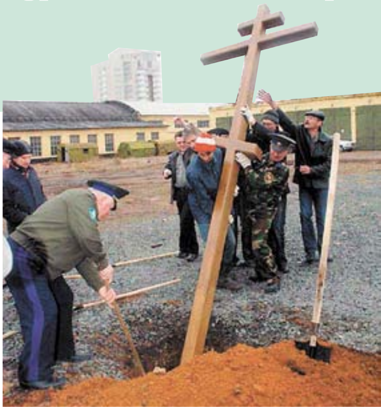
Установка поклонного креста на месте монастырского кладбища