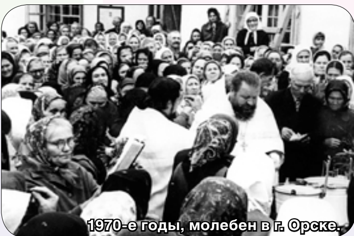
1970-е годы, молебен в г. Орске.

В погоне за блеском мишурным Не видим мы блеска небес, Не тянет нас к безднам лазурным, Где бездна таится чудес.