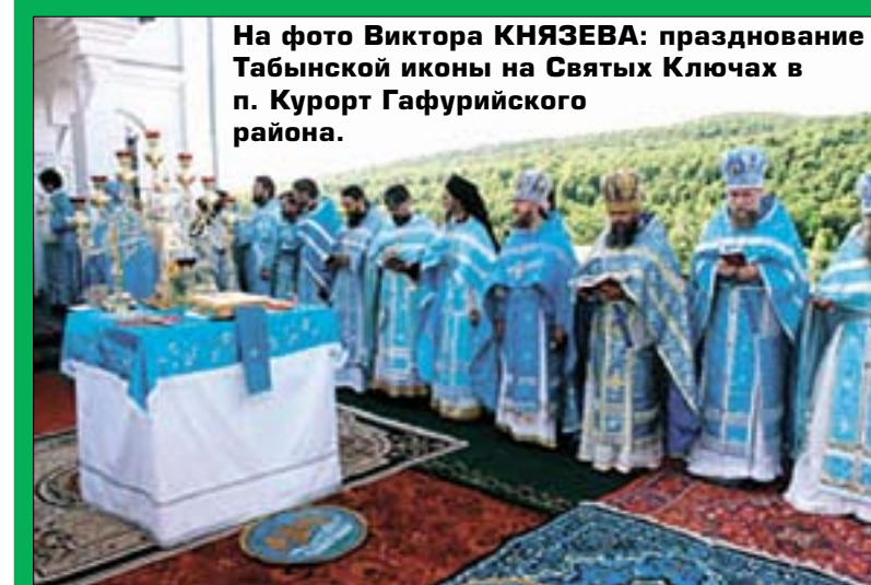
празднование Табынской иконы на Святых Ключах в п. Курорт Гафурийского района.

С целью восстановления большого исторического Крестного хода с иконой Табынская казаки направили прошение на имя Патриарха Московского и всея Руси Кирилла.