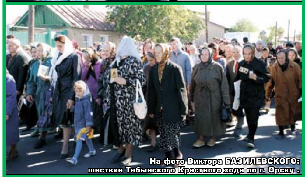
На фото Виктора БАЗИЛЕВСКОГО: шествие Табынского Крестного хода по г. Орску.