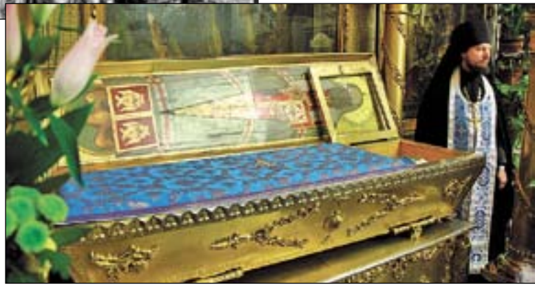
Рака с мощами Святейтеля Тихона в Донском монастыре.

Вскоре после похорон келейника Патриарх посещал его могилу на Донском кладбище, и в него выпустили две пули, но промахнулись. Однако очережное дерзкое покушение на его жизнь не прошло бесследно. "Святейший Тихон, - писал современник, - сильно ослабел и страшно переутомился. Он часто служит и ежедневно делает приемы. К нему едут со всех концов России. У него заведен такой порядок: он принимает каждый день не более пятидесяти человек, с архиереями говорит не более десяти, а с прочими не более пяти минут. Он сильно постарел и выглядит глубоким старцем. Около него нет ни Сичашу, высокий мужчина в полумонашеском одеянии выхватил из-под одежды дубинку и с криком: "Тихон, мы уйдем тебя!" - опустил ее на митрополита Петра, приняв его по ошибке за Патриарха. К счастью, удар пришелся только по плечу. Стоявшие рядом иподиаконы момен-