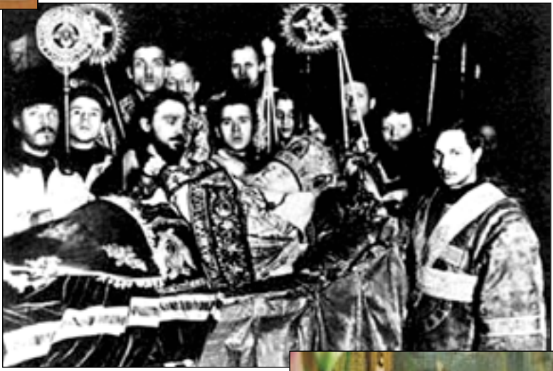
У гроба Патриарха Тихона.

7 апреля 1925 г., в день Благовещения Пресвятой Богородицы, Патриарх прослушал всю праздничную службу, прочитан-