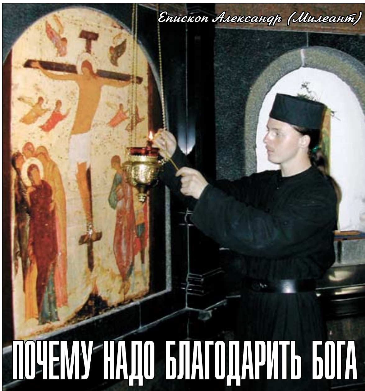
Епископ Александр (Милеант)

Хотя мы не видим Бога глазами, но мы знаем, что Он постоянно заботится о нашем благе более самой любящей матери. Он повелевает сиять над нами солнцу, которое освещает и согревает, увеселяет и оживляет нас. Он благоволит нам, посылая дождь и плодородие, насыщая нас пищей и веселя наши сердца. Он заповедал земле производить разнообразные плоды, которыми питается и живет наше тело, и заставляет животных служить