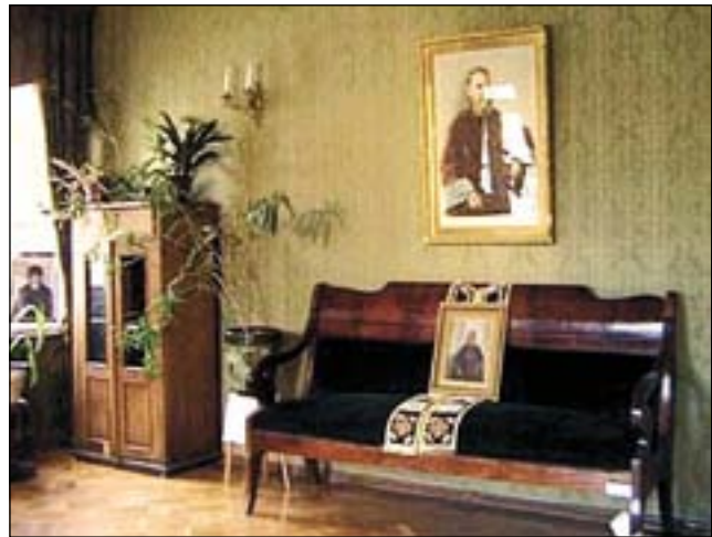
Музей-квартира св. Иоанна Кронштадтского.

«Моя жизнь во Христе» уже вскоре после своего выхода в свет, настольно привлекла к себе всеобщее внимание, что была переведена на несколько иностранных языков.