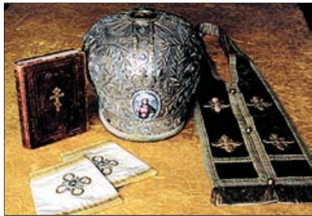
Евангелие, митра, епитрахиль и поручи святого праведного Иоанна Кронштадтского.

И вот скоро вся верующая Россия потекла к великому и дивному чудотворцу. Наступил второй период его славной жизни, его подвигов. Вна-