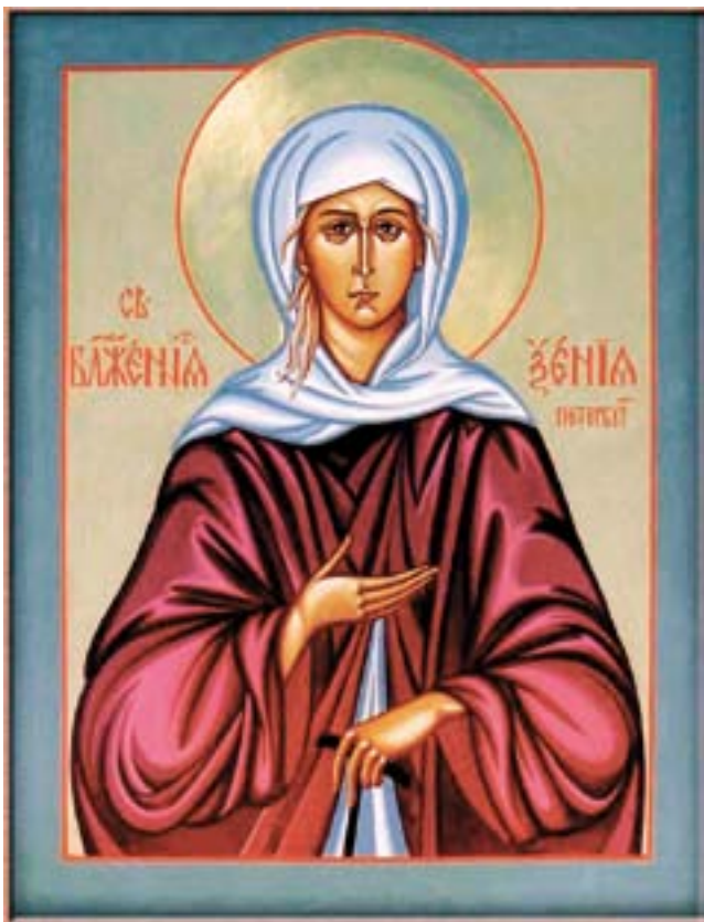
6 февраля Церковь отмечает память святой блаженной Ксении Петербургской.