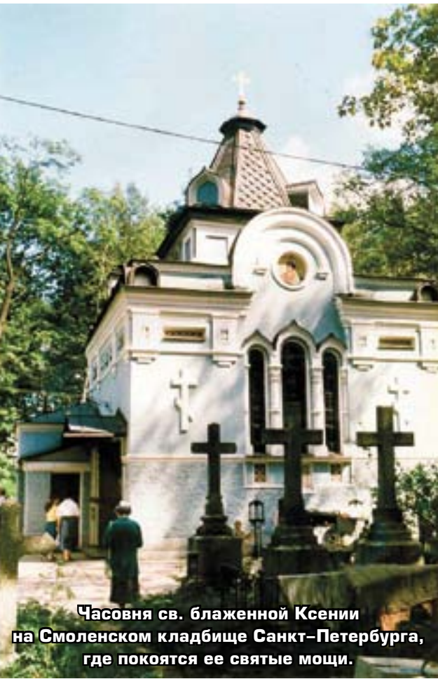
Часовня св. блаженной Ксении на Смоленском кладбище Санкт-Петербурга, где покоятся ее святые мощи.

Панихиды служились одна за другой... И теперь тот, кто молит усердно, Получает поддержку и помощь Святой Петербургской подвижницы Ксении.