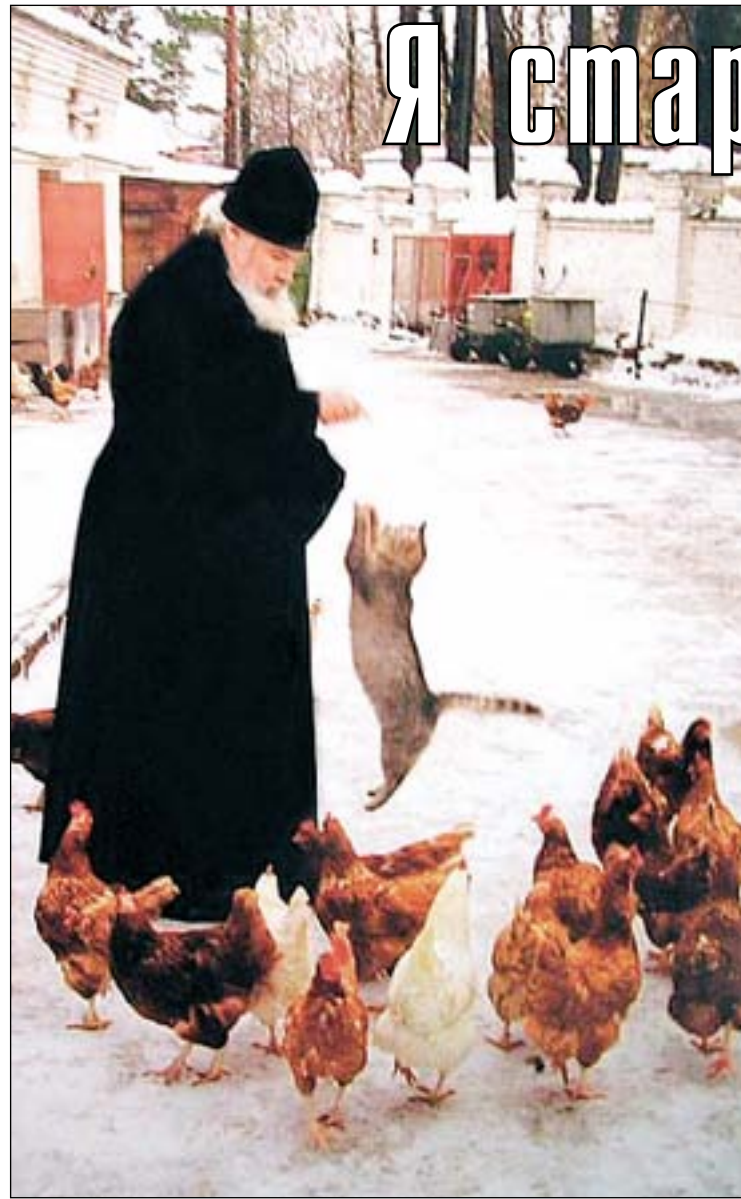
Продолжение. Начало в № 22.

– Любите ли вы утра? Бывает, что просыпаешься в плохом настроении, или грех уныния вам чужд?