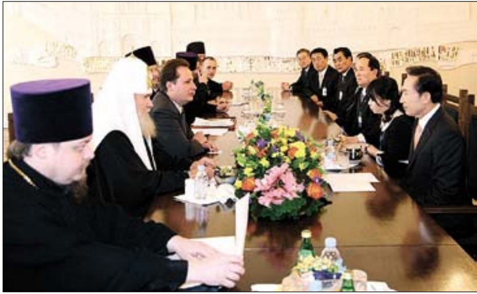
Окончание. Начало на 4-5-й стр.

В 90-х гг. XX в. имел место острый кризис во взаимоотношениях Русской и Константинопольской Церквей, вызванный ситуацией в Эстонии. Националистически настроенная часть эстонского духовенства объявила о своем подчинении неканоническому зарубежному «синоду», после чего при поощрении властей начался захват раскольниковыми приходов канонической Эстонской Церкви. Патриарх Алексий, 25 лет посвятивший архипастырскому окормлению Православной Церкви в Эстонии, очень остро переживал раскол в эстонском духовенстве. Было предпринято много шагов для урегулирования этого вопроса.