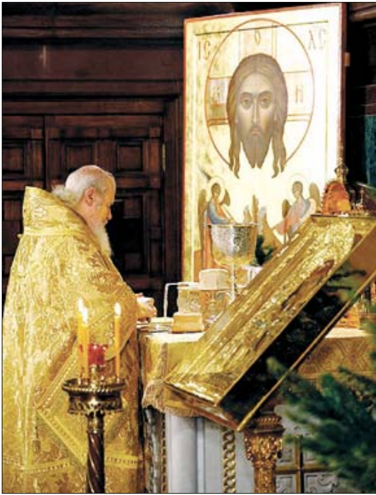
Окончание. Начало в № 22.

После интронизации, 14 июня, Патриарх Алексей отправился в Ленинград, для того чтобы совершить прославление св. праведного Иоанна Кронштадтского. Вернувшись в Москву, встретился с московским духовенством. Он говорил о том, что новый Устав об управлении РПЦ позволяет возрождать соборность на всех уровнях церковной жизни и что начинать надо с прихода. Первое выступление Предстоятеля содержало емкую и конкретную