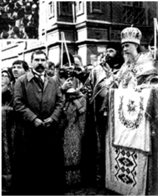
Патриарх Тихон служит молебен.

Его встретил крестный ход во главе с митрополитом Венямином. Свое приветствие митрополит закончил словами, что и сам он, и духовенство, и все верующие готовы за веру и Церковь принести любые жертвы и даже умереть. “Умереть нынче немудрено, – улынулся в ответ Патриарх. – Нынче труднее научиться, как жить”. За шесть дней, проведенных в Петрограде и Кронштадте, Святейшего постоянно окружали толпы народа, устлавшие его путь цветами, часами