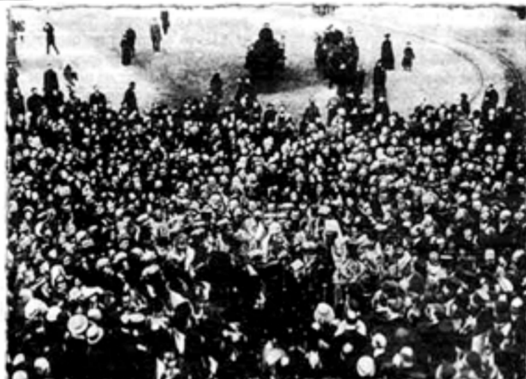
Встреча Патриарха Тихона в Петрограде.

А вы, братие архиереи и пастыри, не медля ни одного часа в нашем духовном делании, с пламенной ревностью зовите чад ваших на защиту