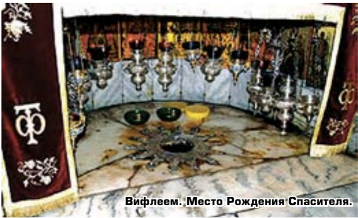
Вифлем. Место Рождения Спасителя.