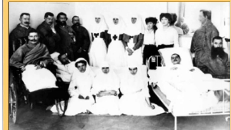
На снимках: Семья святых Царственных страстотерпцев Романовых; Императрица Александра Федоровна за вышиванием; Княжны Татьяна, Мария (сидят) и Ольга (стоит) в военном госпитале; Княжны Романовы с сестрами милосердия и ранеными солдатами.

благочестивой христианской жизни Царской Семьи, — все эти аргументы послужили серьезным основанием для единогласного голосования за прославление Царственных мучеников в лике страстотерпцев...».