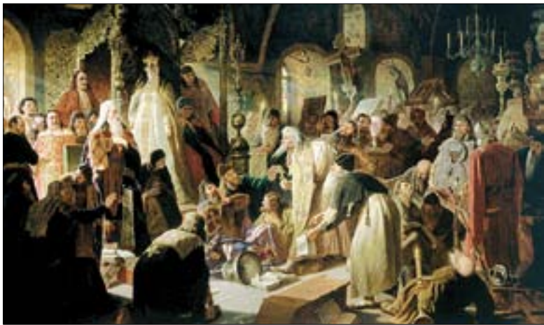
«Прения о вере» в присутствии Патриарха Иоакима и царевны Софьи.

слушали его. Они просто кричали: «Вот так креститься», — и поднимали руки с двуперстным знамением. Тогда выступил архиепископ Холмогорский Афанасий, некогда тоже бывший старообрядцем. Со знанием дела он противопоставил Никите такие доводы, против которых тот возражать ничего не мог, и потому в бес- сильной ярости набросился на архиерея и ударил его по лицу. Произошло смятение. Все восприняли это как оскорбление и