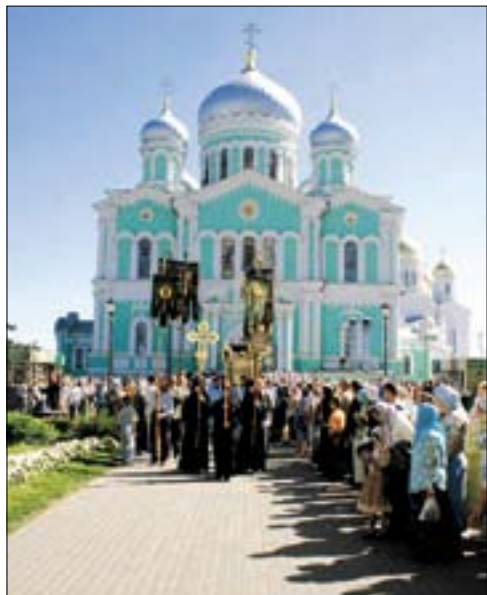
Крестный ход на Канавку Пресвятой Богородицы в Серафимо-Дивеевском монастыре.

Незабываемым событием явилось посещение Дивеева – Четвертого удела Пресвятой Богородицы во Вселенной для группы паломников из храма Георгия Победоносца г. Орска. В данном храме ведется большая работа по воцерковлению прихожан разного возраста, относящихся к различным слоям населения. Паломнические поездки, которые здесь организуют, помогают в духовном обогащении членов паствы.