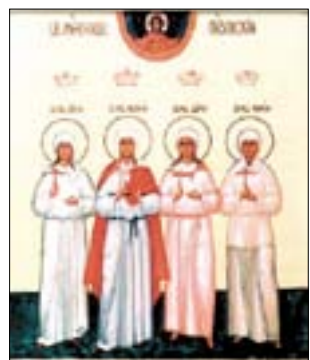
Икона святых мучениц Пузовских Евдокии, Дарьи, Дарьи и Марии.

Паломничество необходимо для каждого христианина. Истари верующие старались посетить святые места и обители. Сегодня давние традиции возрождаются. Люди стремятся постичь основы веры и православия, изучить историю Русской Православной Церкви, соприкоснуться с истоками возникновения христианства и монашества на Руси. Поскольку не мыслят без всего этого всей правды и полноты истории нашей Родины. Да и ее развитие и возникновение невозможно представить без приобщения народа к общенациональным святыням, без общезначимых духовных, историко-культурных центров.