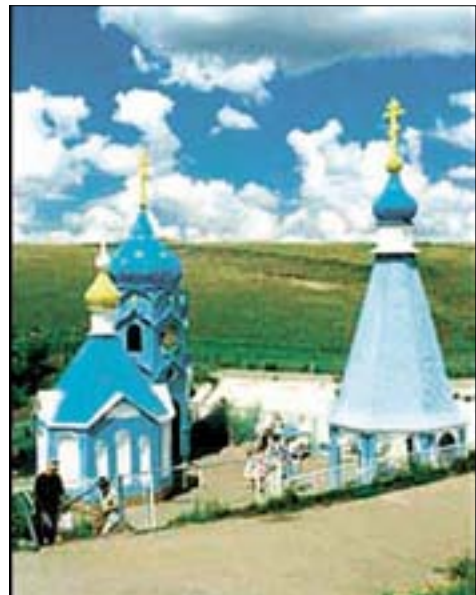
На святом источнике Пресвятой Богородицы "Избавительница от бед" в с. Ташла.