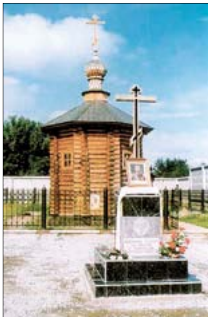
1998 г. Часовня и крест на месте расстрела Царской семьи.