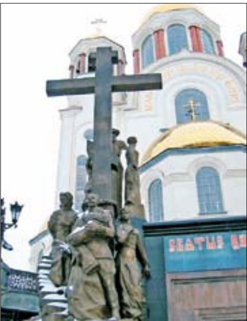
2008 г. Храм Спаса-на-Крови и памятник на месте расстрела Царской семьи.