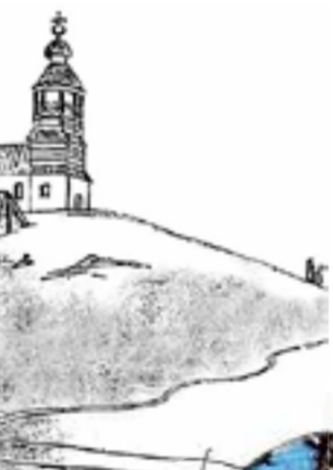
Полукаменная церковь на горе Преображенской, построенная в 1751 г.

Саровская пустынь. Сюда, после заточения в Орской крепости, возвратился иеромонах Ефрем и в 1758 г. был поставлен настоятелем монастыря.