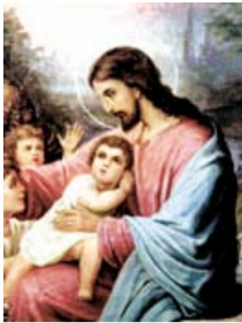
Пасхальное воскресенье под «Христов Воскрес».