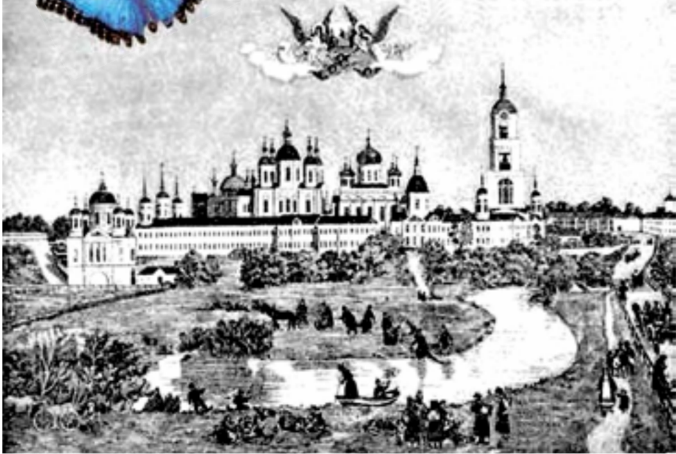
Саровская пустынь. Сюда, после заточения в Орской крепости, возвратился иеромонах Ефрем и в 1758 г. был поставлен настоятелем монастыря.

При отце Ефреме Саровская пустынь быстро начала процветать и приходить в совершенство. Смирренный, подвиголюбивый старец, живший в обители, возлюбил совершенное безмолвие. Лю-