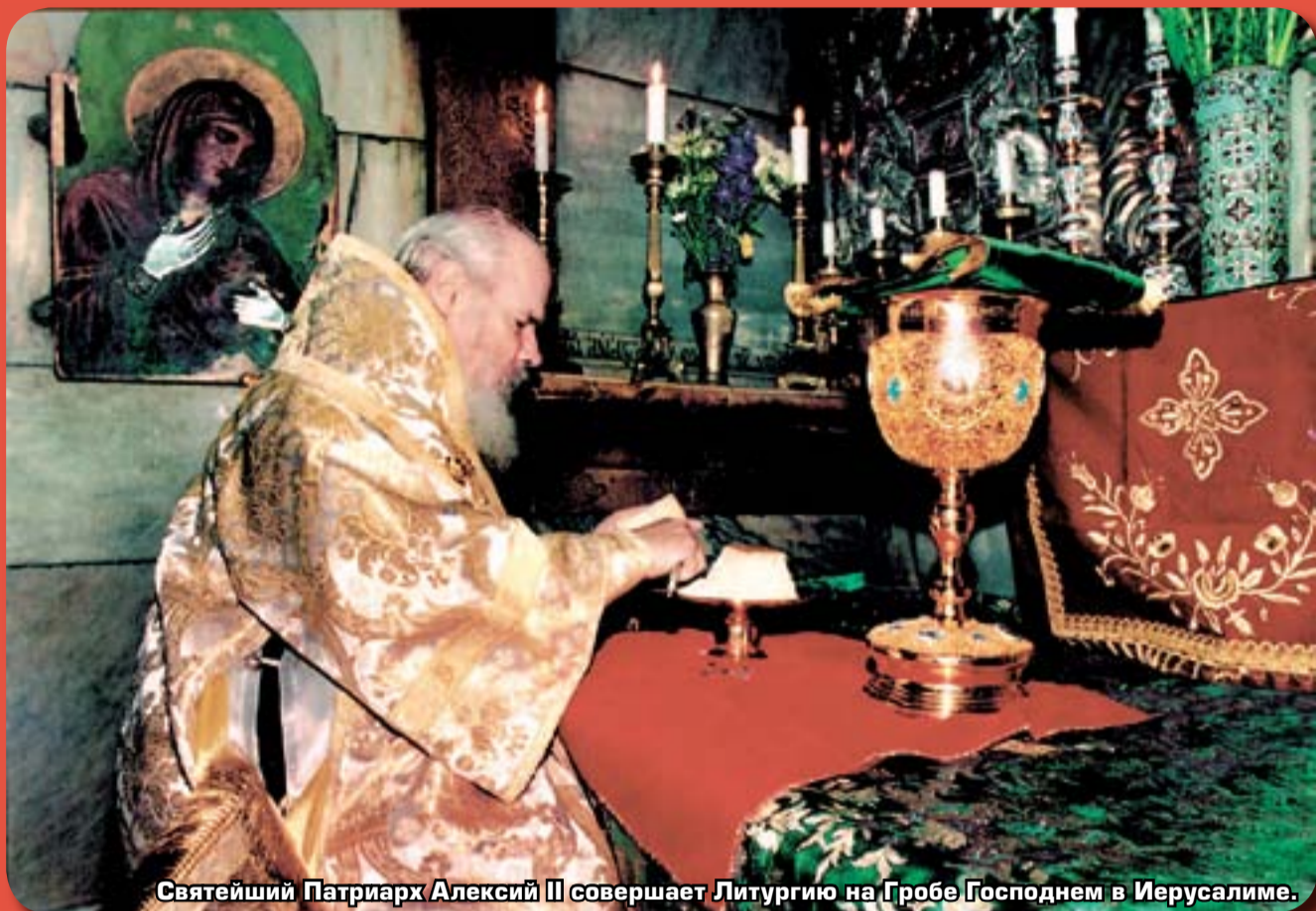
Святейший Патриарх Алексий II совершает Литургию на Гробе Господнем в Иерусалиме.