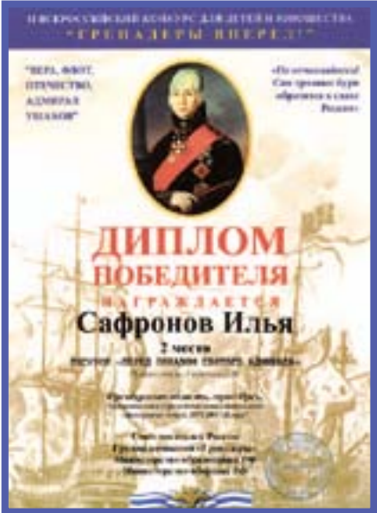
Диплом лауреата конкурса “Гренадеры, вперед!”