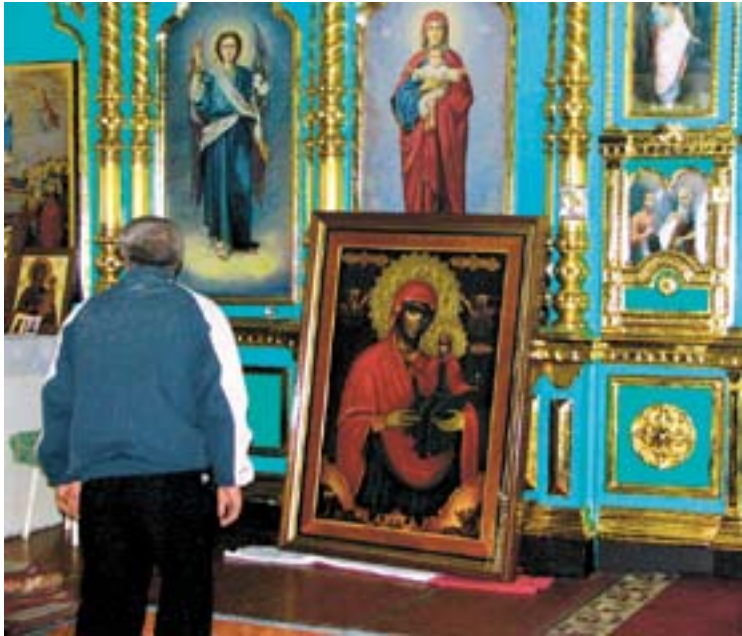
Список чудотворной афонской иконы, изображающей святую праведную Анну с Пресвятой Богородицей на руках.

Петербург... Много горя видел этот город за последние сто лет: революции, голод, война, блокада, кровь... смерть. «Держись же, Россия, твердо веры своей и Церкви, и Царя православного, если хочешь быть непоколебимой...» А если отпадешь от своей веры, как отпали от нее многие интеллигенты, то не будешь... Русью Святою, а сбродом всяких иноверцев, стремящихся истребить друг друга... Если не будет покаяния у русского народа, – ко-