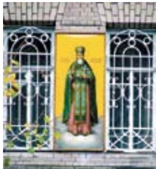
Ставропигиальный Иоанновский монастырь, г. Санкт-Петербург.