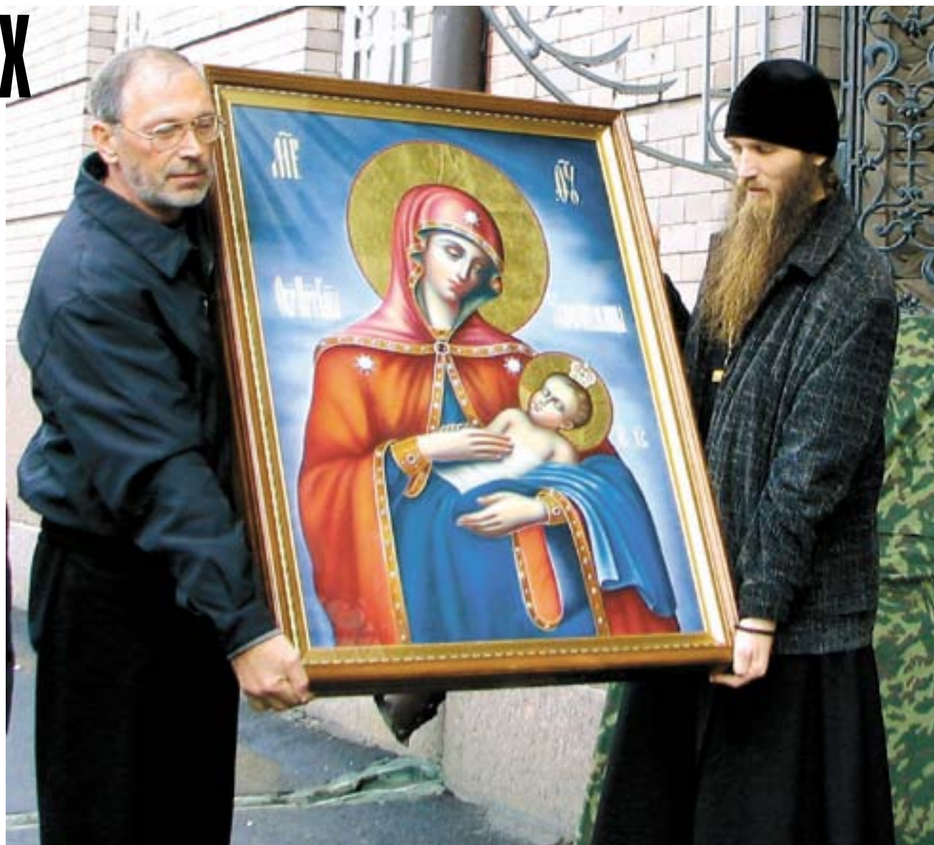
Список с афонской иконы Божией Матери «Успокоительница». Пресвятая Богородица держит на руках спящего Младенца Иисуса Христа. Младенец прикрыл глаза, потому что терпит и ждет нашего покаяния. Спит Господь, но не сном, а долготерпением.