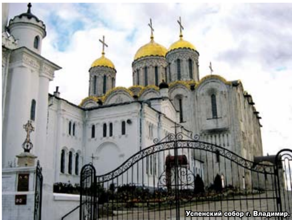
Успенский собор г. Владимир.