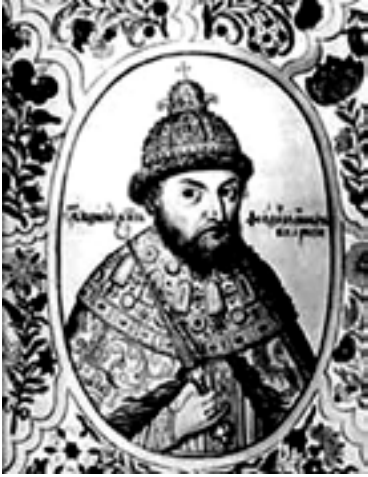
Царь Федор Иванович.

По долгу верноподданного, и по чувству признательности Иов с полным усердием служил царю Федору Ивановичу, по воле которого удостоился быть сперва митрополитом, а потом и Патриархом. В начале