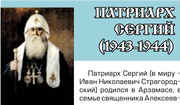
ПАТРИАРХ СЕРГИЙ (1943-1944)

Избран Патриархом на Поместном Соборе в 1918 году. В 1922 году арестован и предан суду по делу об изъятии церковных ценностей. В 1922–1923 годах находился под строгим домашним арестом в Донском монастыре. После освобождения вел острую полемику с обновленческим расколом. Канонизирован в 1989 году.