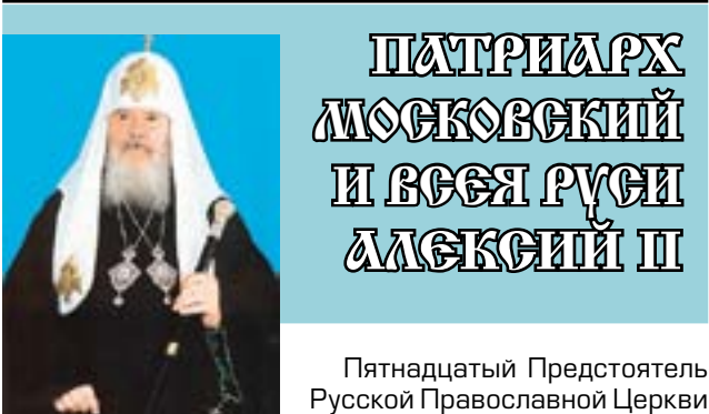
ПАТРИАРХ МОСКОВСКИЙ И ВСЕЯ РУСИ АЛЕКСЕЙ II

Патриарх Пимен (в миру – Сергей Михайлович Извеков) родился в 1910 году в Богородске После окончания школы в Сретенском монастыре принял постриг с именем Пимен. Через некоторое время становится наместником Псково-Печерского монастыря и возводится в сан архимандрита Затем был рукоположен в епископа Балтского. В том же году назначен викарием Московской епархии, а еще через три года – управляющим делами Московской Патриархии. Позже становится архиепископом и входит в состав Священного Синода. В 1963 году Пимен возводится в сан митрополита Крутицкого и Коломенского. После кончины Патриарха Алексия I в 1970 году Поместный Собор избирает Пимена новым Предстоятелем Русской Церкви. Наиболее важным событием в его патриаршество стало празднование 1000-летия Крещения Руси и проведение Поместного Собора Русской Церкви 1988 года, на котором был принят Устав об управлении Русской Православной Церковью.