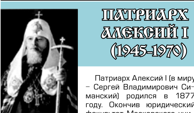
ПАТРИАРХ АЛЕКСЕЙ I (1945-1970)

С 1927 года митрополит Сергей стал патриаршим местоблюстителем. Ему выпала нелегкая доля возглавлять Русскую Церковь и во времена свирепейших репрессий 30-х годов, и в период Великой Отечественной войны. Официально митрополит Сергей стал Патриархом только в 1943 году, после избрания его Архиерейским Собором.