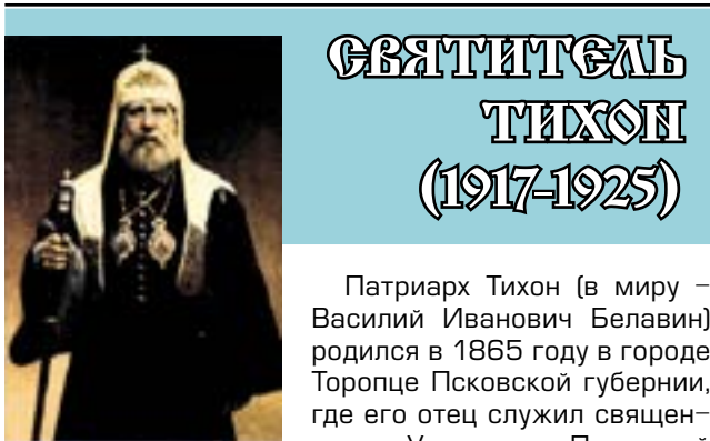
СВЯТИТЕЛЬ ТИХОН (1917-1925)

Патриарх Адриан родился в Москве в 1627 году. О его жизни до пострижения не осталось никаких сведений. В монашестве же он был необыкновенно благочестив, так что о нем узнал Патриарх Иоаким и в 1678 году назначил Адриана архимандритом кремлевского Чудова монастыря. В 1686 году Адриан был рукоположен в митрополита Казанского и Свияжского. Во время болезни Иоакима Адриан был его правой рукой, а после смерти Патриарха управлял Московской епархией, продолжая называться митрополитом Казанским и Свияжским. В 1690 году он был возведен на патриарший престол. Являясь преемником Патриарха Иоакима не только по очередности, но и по духу, и будучи столь же строгим и убежденным ревнителем благочестия и традиций, Адриан с большою смелостью на нововведения Петра I – брадобритие, курение, отмену русской национальной одежды. После смерти Адриана в 1700 году Петр I так и не назначил предполагавшихся выборов Патриарха, а с 1721 года в истории Русской Церкви начался новый период, получивший название Синодального.