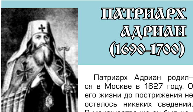
ПАТРИАРХ АДРИАН (1690-1700)

Патриарх Иоаким родился в 1620 году и был выходцем из дворянского рода Савеловых. Молодые годы он провел на военной службе. После смерти жены ушел в Киевский Межигорский монастырь, где принял монашеский постриг. Через некоторое время перешел в Новгородский Иверский монастырь, а вскоре был переведен в Москву, где подвизался сначала в Андреевском, а затем в Ново-Спасском монастырях. В 1672 году рукоположен в митрополита Новгородского. На патриарший престол Иоаким был возведен в 1674 году. Иоаким принимал деятельное участие в религиозной и политической жизни страны. Он боролся против иностранного влияния на русское общество, которое шло тогда через Польшу. Первосвященитель ревностно следил и за строгим исполнением церковных канонов. По его ходатайству храмы впервые получили земельные наделы.