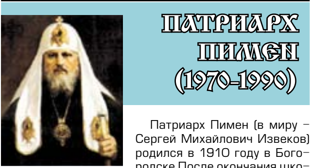
ПАТРИАРХ ПИМЕН (1970-1990)

Алексей I сделал многое для восстановления разорванных после революции связей с зарубежными епархиями и приходами Русской Церкви, а также с другими Православными Церквями. Была возобновлена издательская деятельность Московской патриархии, однако на период его председательствования пришелся тяжелый период новых гонений на церковь.