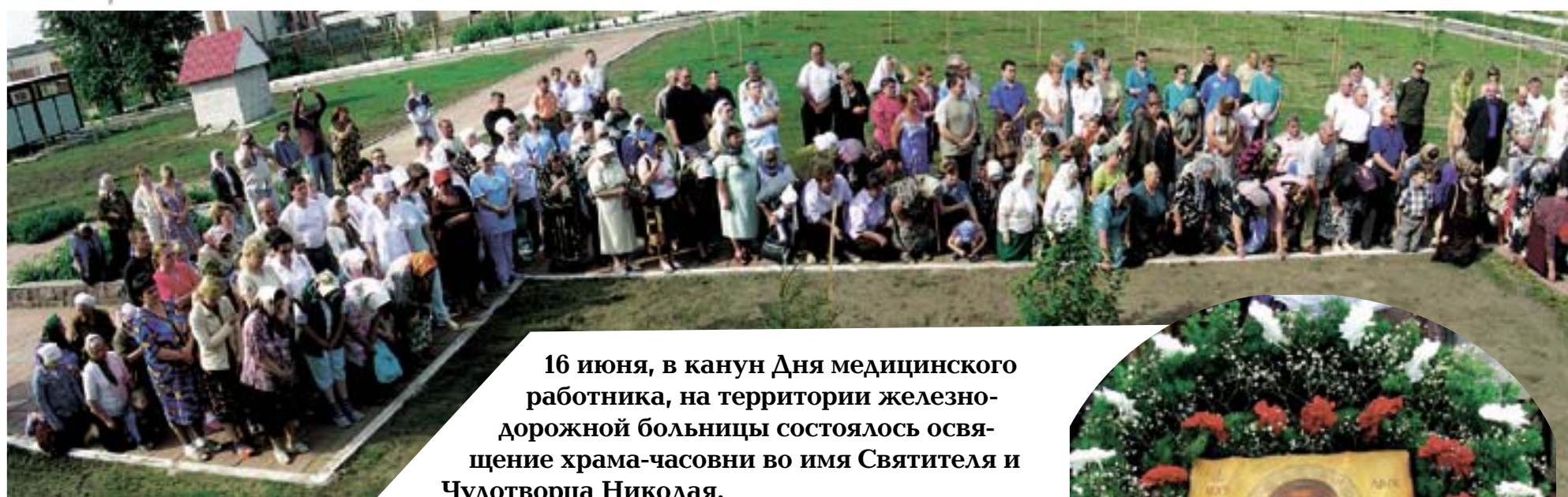
16 июня, в канун Дня медицинского работника, на территории железнодорожной больницы состоялось освящение храма-часовни во имя Святителя и Чудотворца Николая.