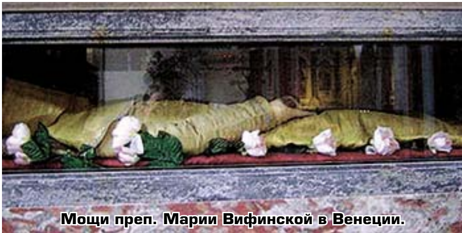
Мощи преп. Марии Вифинской в Венеции.

Так прошло 3 года. Братия обители, видя такое его ревностное и жертвенное житие, приступила к игумену с требованием вернуть Марина в монастырь, поскольку, по мнению монахов, он искупил вину своей подвижницкой жизнью. Они грозили даже покинуть монастырь, если игумен не примет их условия.