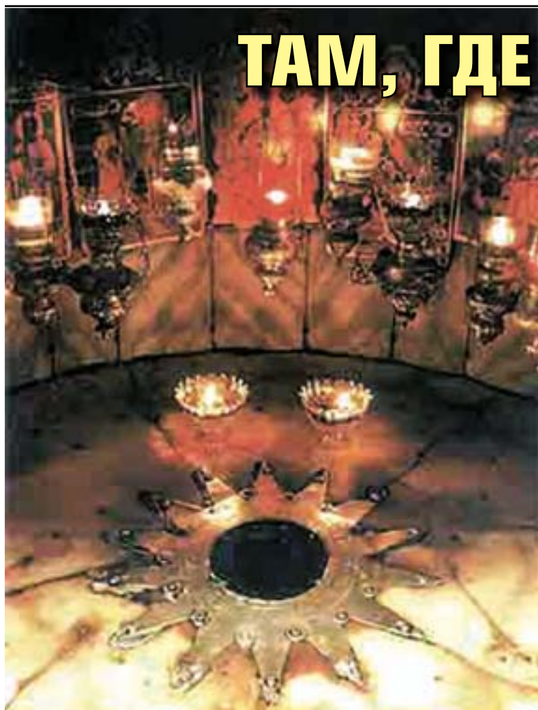
Вифлеемская звезда на месте рождения Спасителя.

Вифлеем, Вифлеемская звезда – эти слова для любого христианина навсегда связа-ны с рождением Спасителя. О Вифлееме напоминает и би-блейское сказание. Находится он на территории Палестинс-кой автономии, в 7 километрах от Иерусалима. Почти полови-на из 40-тысячного населения города – христиане. Примерно 30 тысяч верующих прибыва-ют сюда ежегодно, чтобы от-праздновать Рождество Хрис-това.