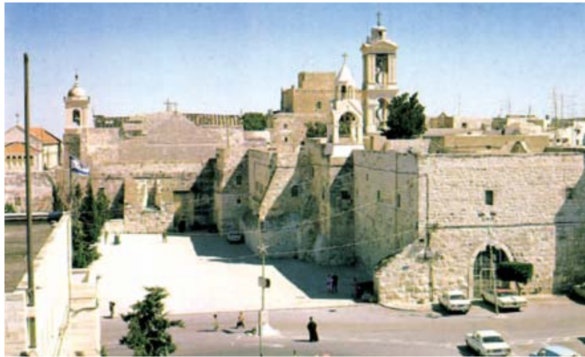
Храм Рождества Христова в Вифлееме.

Под центральной частью церкви находится пещера Рождества. Туда можно спу-ститься через один из двух входов по большим каменным ступеням. В неглубокой нише помещается алтарь, перед ко-торым горят десятки свечей. Посреди гота, символизируя яркую звезду, явившуюся над местом, где родился Христос, на полу лежит большая сереб-ряная звезда. На ней надпись на латинском: “Здесь дева Ма-рия родила Иисуса Христа”.