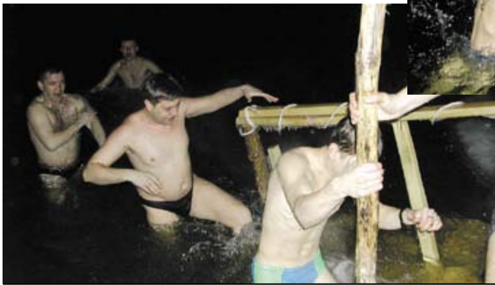
Тысячи орчан омываются в водах Урала в праздник Крещения Господня.

служит на всякую пользу нам. Поэтому эту святыню надо брать с великим страхом и трепетом, она хра-