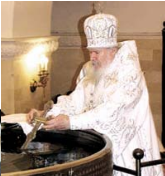
Святейший Патриарх совершает Великое освящение воды.

вые ряды с грязными сосудами, мы и сами – грязные сосуды, не очищенные покаянием от грехов, и не получим благодати Божией. Дух Святой отойдет от воды, вода испортится у нас, станет обыкновенной разлагающейся водой.