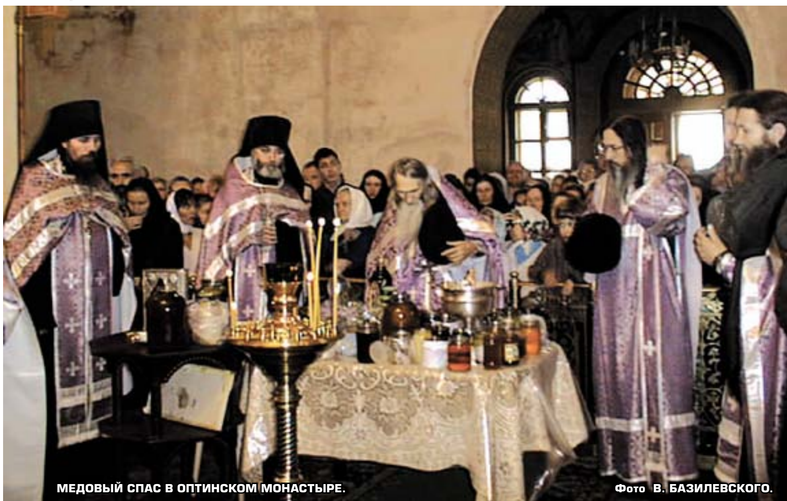
МЕДОВЫЙ СПАС В ОПТИНСКОМ МОНАСТЫРЕ.