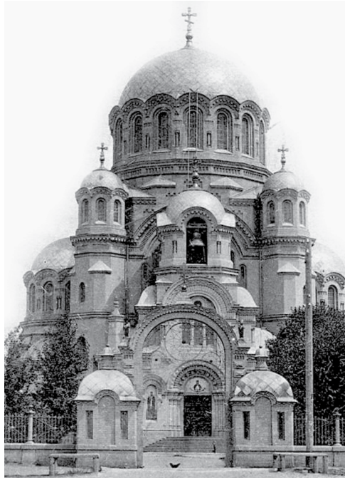
Казанский кафедральный собор в г.Оренбурге

В 1888 г. в Орске учреждена женская община будущего Покровского монастыря. В 1895 г.