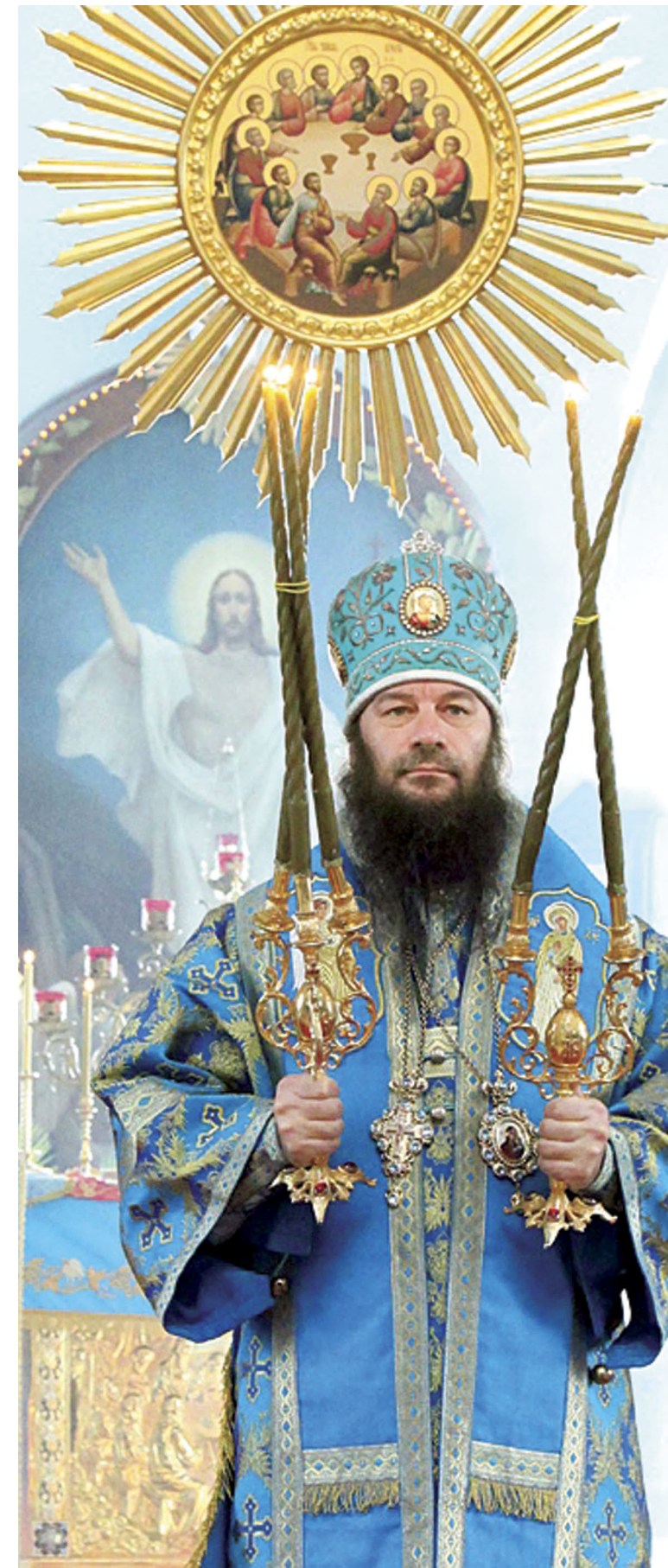
Вопросы для беседы подготовили Татьяна и Виктор БАЗИЛЕВСКИЕ

— Благодарю за добрые пожелания, прошу святых молитв. Простите, стараюсь. Низкий поклон нашим священникам и людям, которые трудятся в поте лица ради Бога.