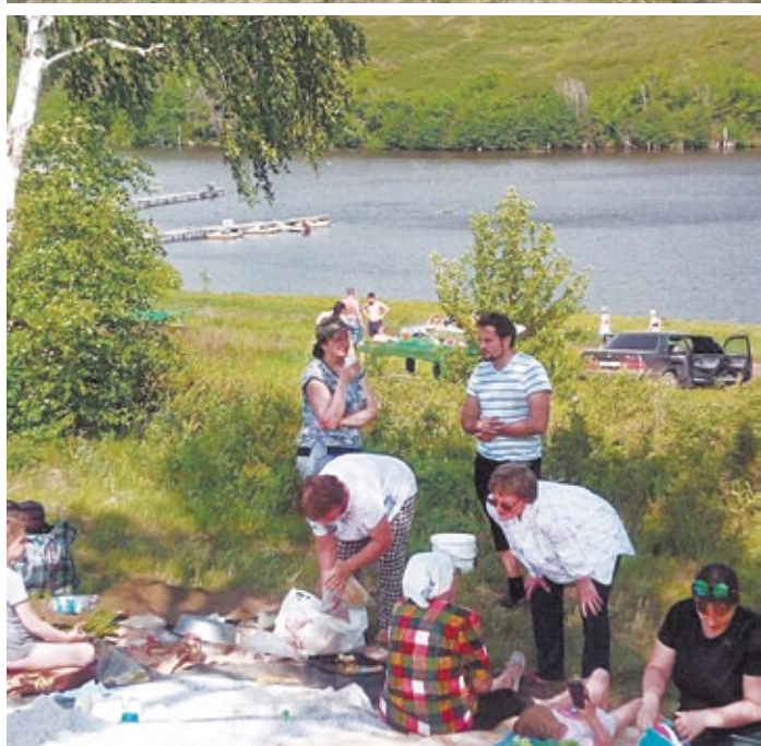
Информация подготовлена Ольгой Александровой по материалам приходов Орской епархии.