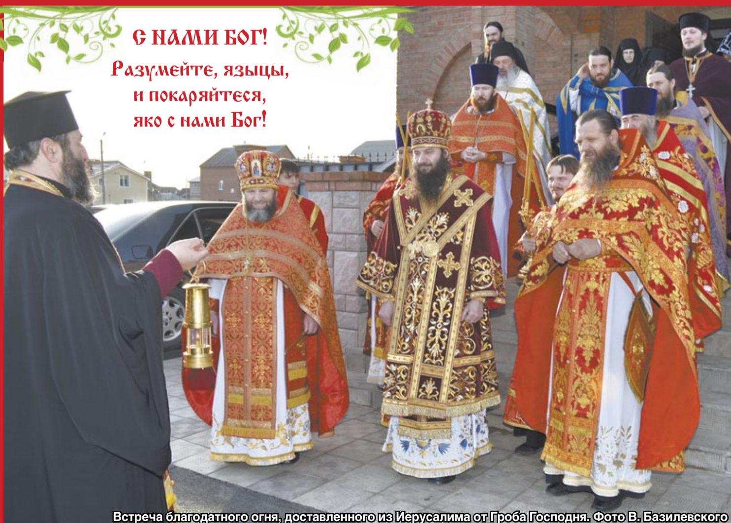
Встреча благодатного огня, доставленного из Иерусалима от Гроба Господня.

Разумейте, языцы, и покайтесь, яко с нами Бог!