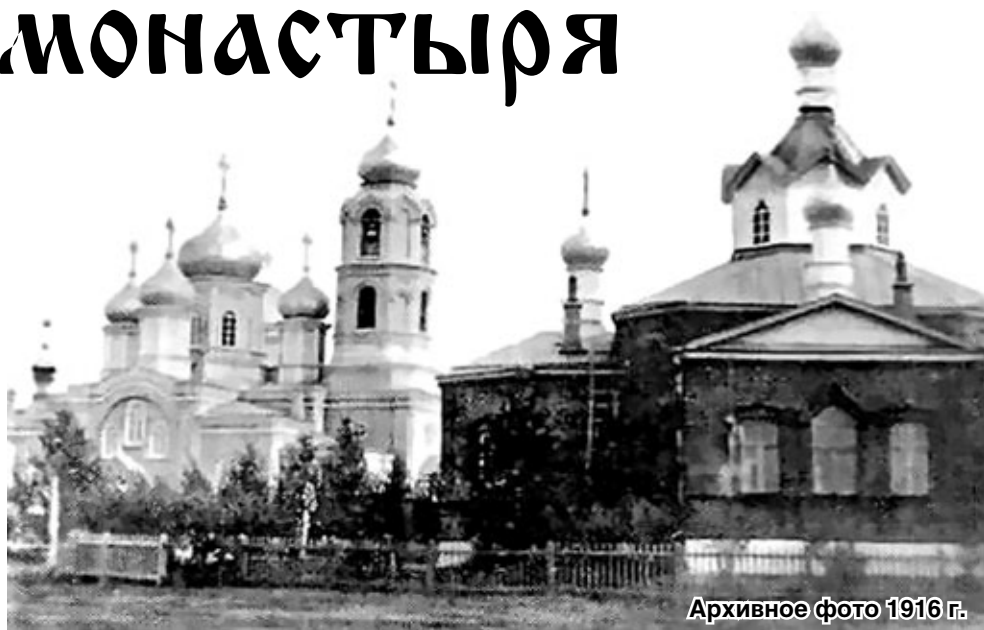
Архивное фото 1916 г.

вой в общине была довольно быстро возведена первая домовая деревянная церковь во имя мученицы Параскевы, ее освящение произошло 30 апреля 1890 г., в 1901 г. она была перестроена с разрешения епископа Оренбургского и Уральского Владимира. Новое здание церкви было возведено на бутовом фундаменте, так же, как и первоначальное, было деревянным, крыша церкви и 5 главок имели металлическое покрытие. Колокольни при церкви не было. Освящение нового здания Параскевинской церкви произошло 10 октября 1902 г. По указу Оренбургской духовной консистории от 28 августа 1909 г. церковь была обложена кирпичом.