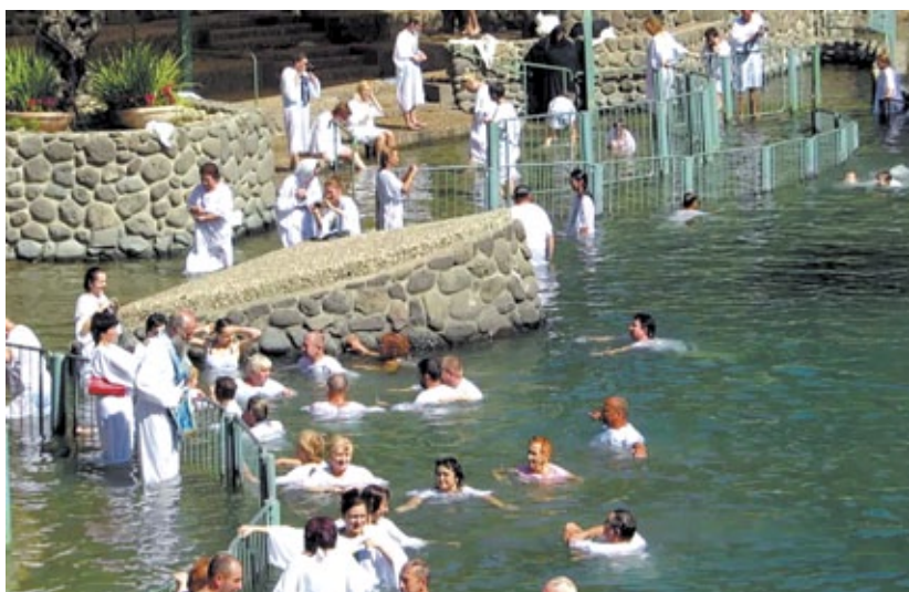
Купание верующих в реке Иордан на месте крещения Иисуса Христа

В СМИ сообщалось о различных чудесах и видениях при реставрации Кувуклии. Но Русская духовная миссия в Иерусалиме опровергла