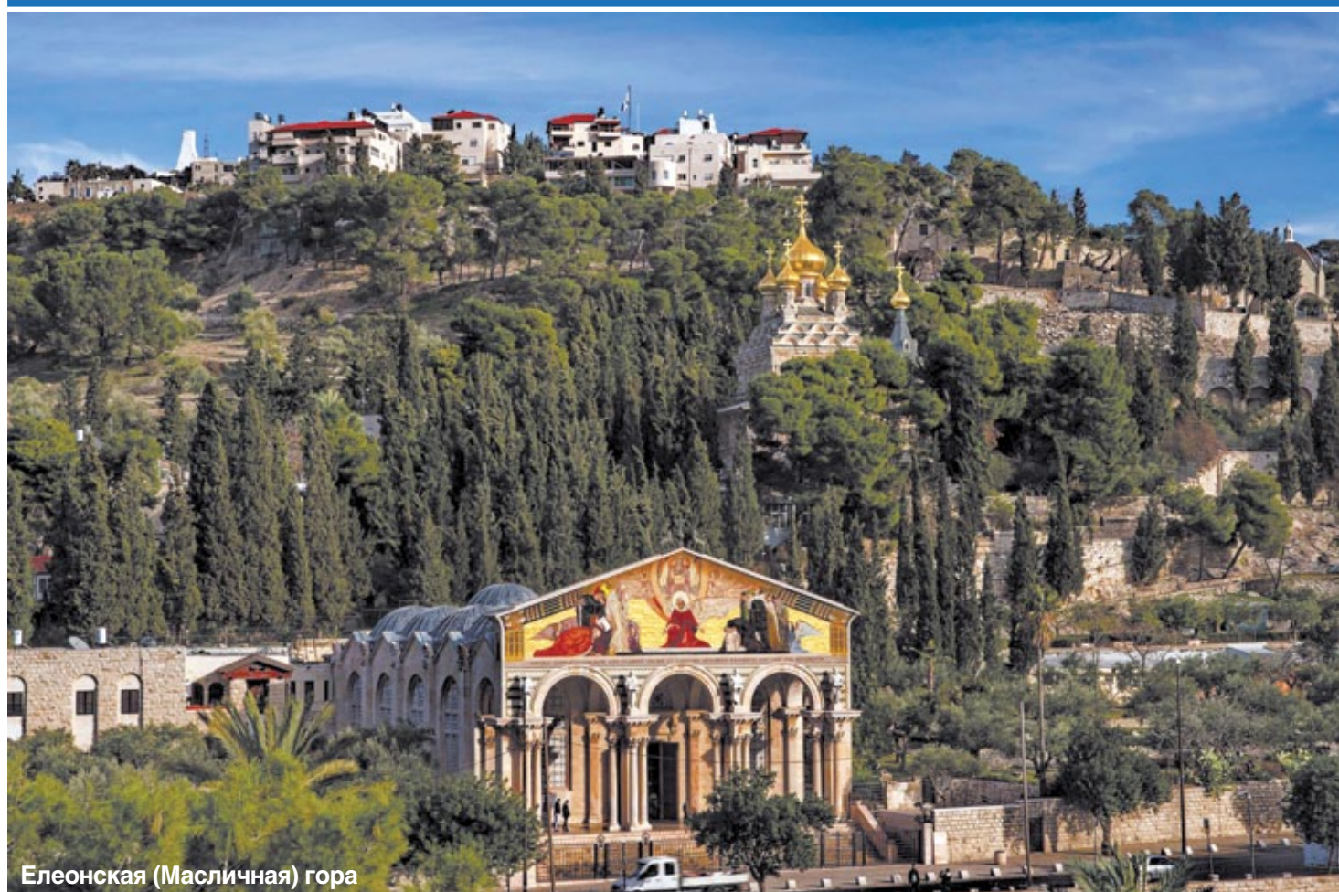
Елеонская (Масличная) гора