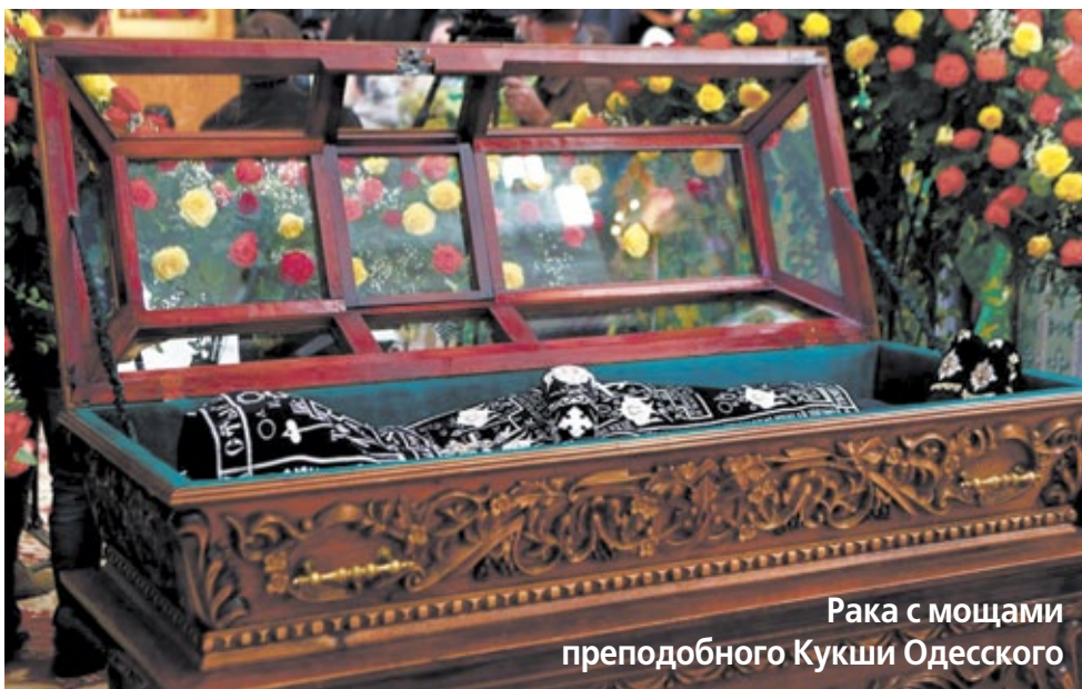
Рака с мощами преподобного Кукши Одесского

Преподобный отче Кукша, моли Бога о нас!