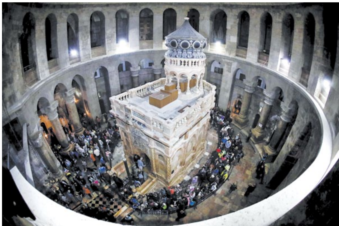
Отреставрированная впервые за 200 лет Кувуклия в храме Гроба Господня в Иерусалиме

Восстановление Кувуклии очень важно для верующих людей, так как появилась надежда на сохранение святыни для будущих поколений.