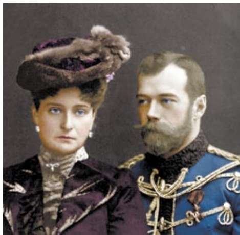
Император Николай II с супругой Александрой Федоровной