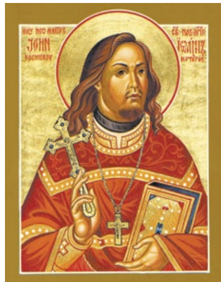
Протоиерей Иоанн Кочуров, первый новомученик Российский

20 ноября – Ликвидация Ставки Верховного главнокомандующего в Могилеве; начало переговоров в Брест-Литовске о перемирии между Советской Республикой и странами германского блока; обращение