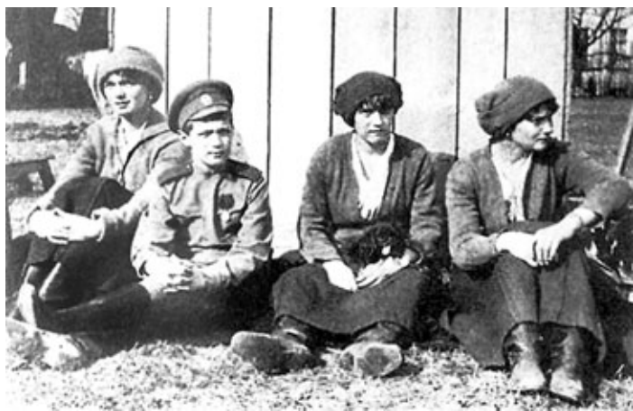
Одна из последних фотографий царских детей

Александровском дворце Царского села под домашним арестом.