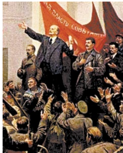
Председатель Совнаркома Владимир Ленин выступает перед войсками Всеобуча

5 мая – Образование первого коалиционного Временного правительства во главе с князем Г.Е. Львовым.