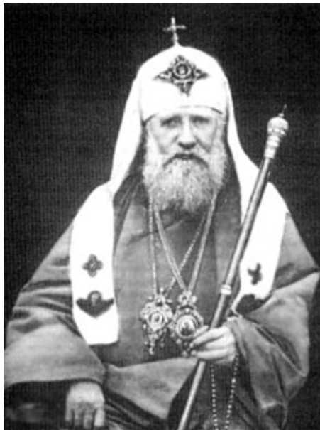
Патриарх Московский и всея России Тихон

6 августа – Царская семья прибывает по реке в город Тобольск.